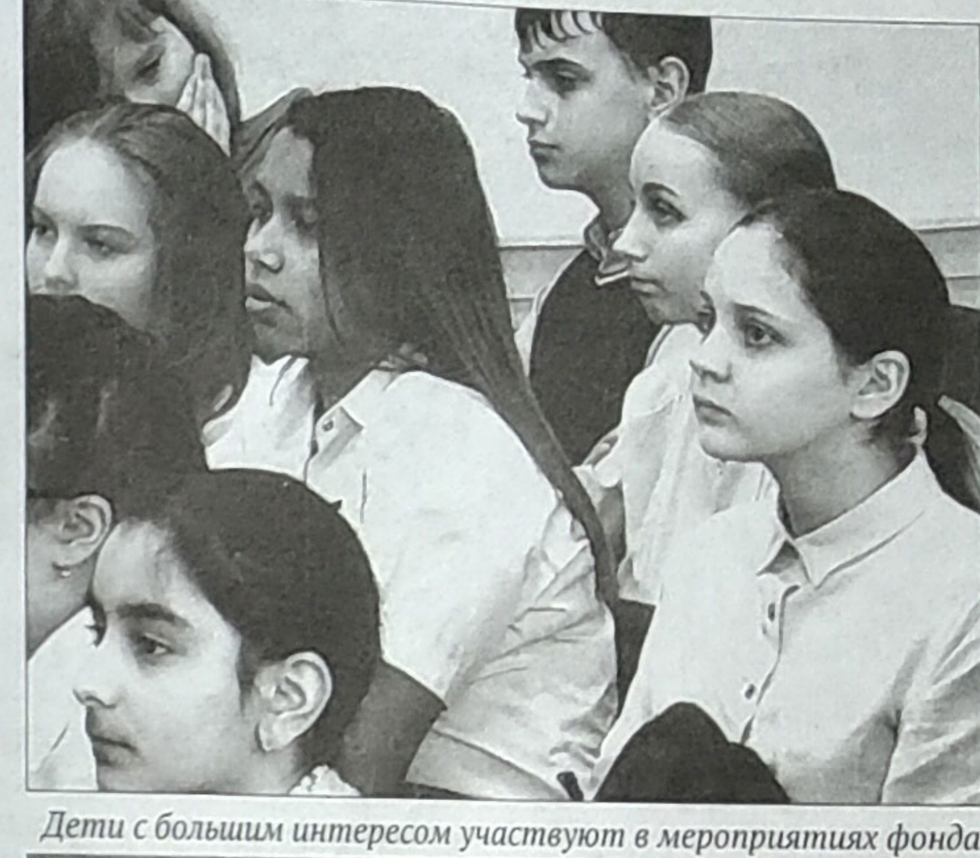
Дети с большим интересом участвуют в мероприятиях фонда.

Благодаря публикации о ветеранах на портале «Книга памяти «Два дня войны» удалось даже восстановить связи нескольких семей. Родственники, искавшие своих героев-фронтовиков и сведе-