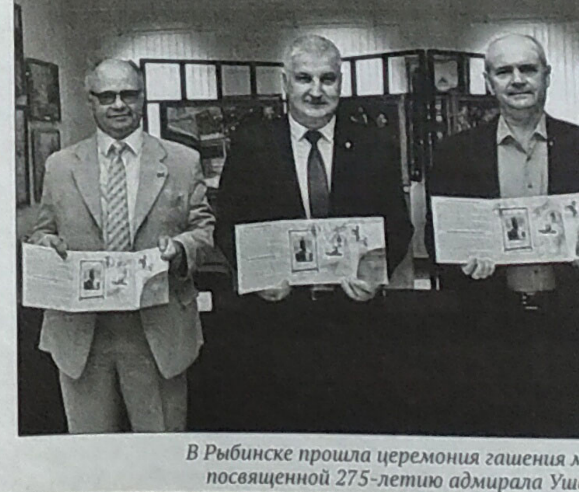
В Рыбинске прошла церемония гашения свечей, посвященная 275-летию адмирала Ушакова.